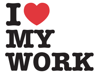
Tabla de Engagement